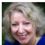
Marilyn Huestis National Institute on Drug Abuse