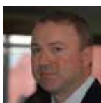
Paul Griffiths European Monitoring Centre for Drugs and Drug Addiction