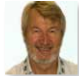
Ettore Zuccato Istituto di Ricerche Farmacologiche "Mario Negri" Milano