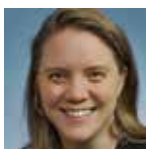
Pirkko Kriikku Hjelt Institute, Department of Forensic Medicine, University of Helsinki