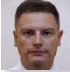
Giampietro Frison Lab. Igiene Ambientale e Tossicologia Forense (LIATF), Dip.to di Prevenzione, ULSS 12 Veneziana, Mestre - Venezia