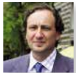
Klaudas Kuchalskis Europol