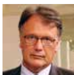
Giovanni Serpelloni Già Capo Dipartimento Politiche Antidroga Presidenza del Consiglio dei Ministri