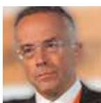
Gilberto Gerra United Nations Office on Drugs and Crime