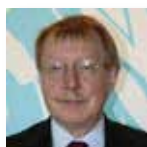
Raymond Yans International Narcotics Control Board