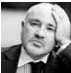
Fabrizio Schifano School of Pharmacy, University of Hertfordshire, UK.