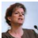
Moirá O'Brien National Institute on Drug Abuse, Epidemiology Research Branch