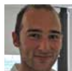
Bjoern Moosmann Institute of Forensic Medicine University Medical Center Freiburg