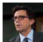
Roumen Sedefov European Monitoring Centre for Drugs and Drug Addiction