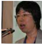
Ruri Kikura-Hanajiri National Institute of Health Sciences - Japan