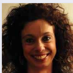
Sabina Strano Rossi

Ricercatore presso il National Institute on Drug Abuse (USA), Intramural Research Program (IRP). Per più di due decenni, ha condotto studi di ricerca su sostanze psicostimolanti utilizzate a scopo terapeutico o ricreazionale. Ha istituito l'Unità di ricerca Designer Drug (DDRU) nell'ambito dell'IRP presso il NIDA che raccoglie, analizza e diffonde informazioni di carattere farmacologico e tossicologico relative alle nuove droghe sintetiche d'abuso (designer drugs). Recentemente, il suo gruppo di lavoro ha individuato il meccanismo molecolare di azione dei catinoni sintetici, composti rintracciati in sostanze psicoattive commercializzate come "sali da bagno". Collabora con l'Agenzia Federale Antidroga statunitense (DEA).